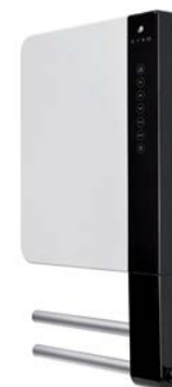
E-Comfort WINDY 2B