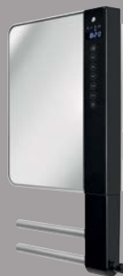
WINDY VISIO (spiegeluitvoering)