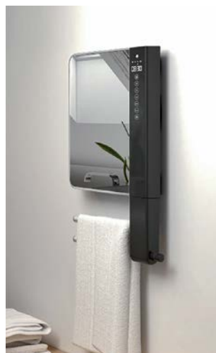
E-Comfort WINDY VISIO (Spiegel)