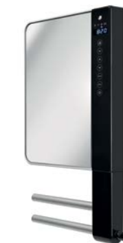
E-Comfort WINDY VISIO (Spiegel)