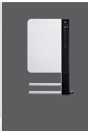
E-Comfort WINDY 2B